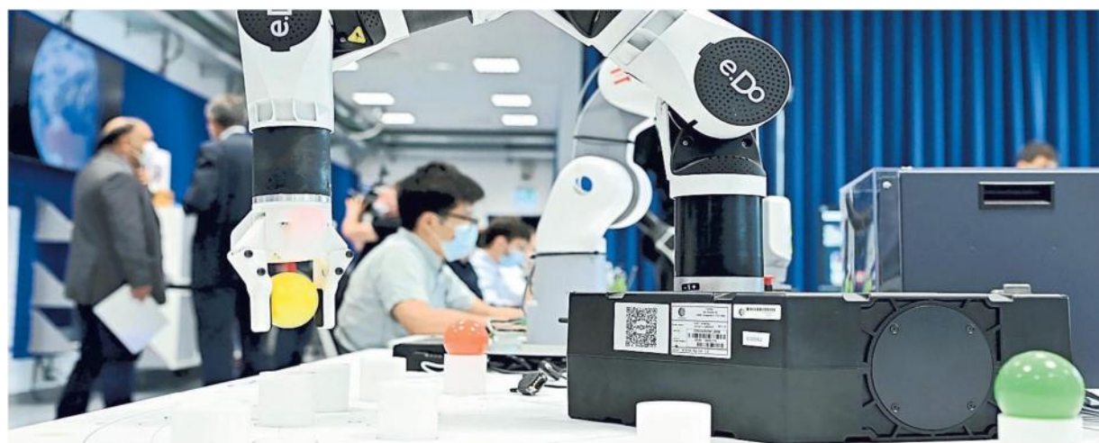
▲ Tradizione tech Un laboratorio del Politecnico di Torino, dove crescono molte startup