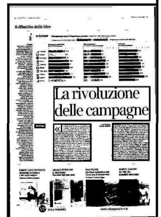
ILLUSTRAZIONE DI ANNA RESMINI

civile spagnola, quando il colpo di Stato militare organizzato da Francisco Franco e altri generali contro il governo del Fronte popolare fallisce nei più importanti centri urbani (Madrid, Barcellona, Valencia) per la reazione delle classi lavoratrici in difesa della Repubblica