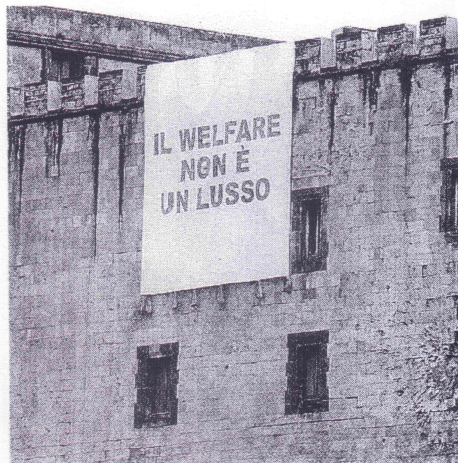
Una manifestazione in difesa del welfare