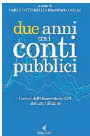
Due anni tra i conti pubblici a cura di Carlo Cottarelli Giampaolo Galli, Feltrinelli