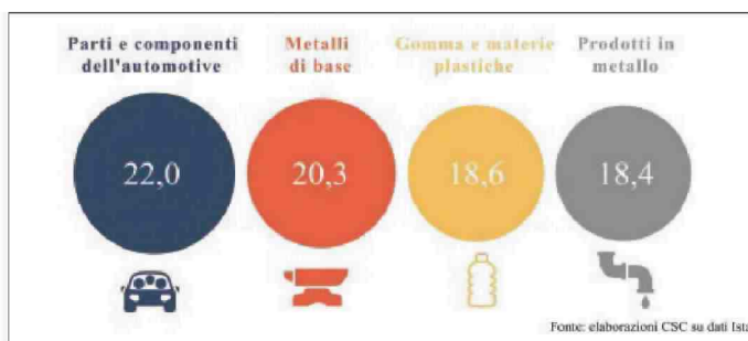
Percentuale di export italiano verso la Germania sul totale settoriale (anno 2017)