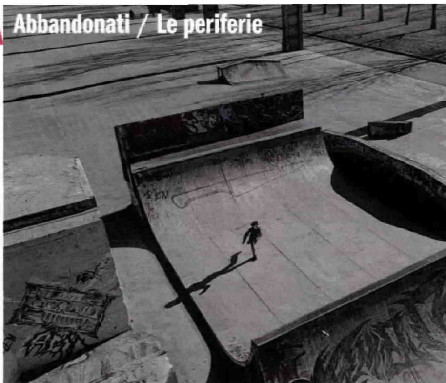
Sopra: il parco Dora, tra la zona di San Donato e Borgo Vittoria, a Torino. A destra, in alto: il campo Rom di via Germagnano, periferia nord della città; in basso: corso Giulio Cesare, che da Barriera di Milano attraversa la zona Regio Parco e porta verso l'A4

Il regolamento di conti piomba sul marciapiede come una folata di vento. Corrono tutti e non si capisce perché. Una