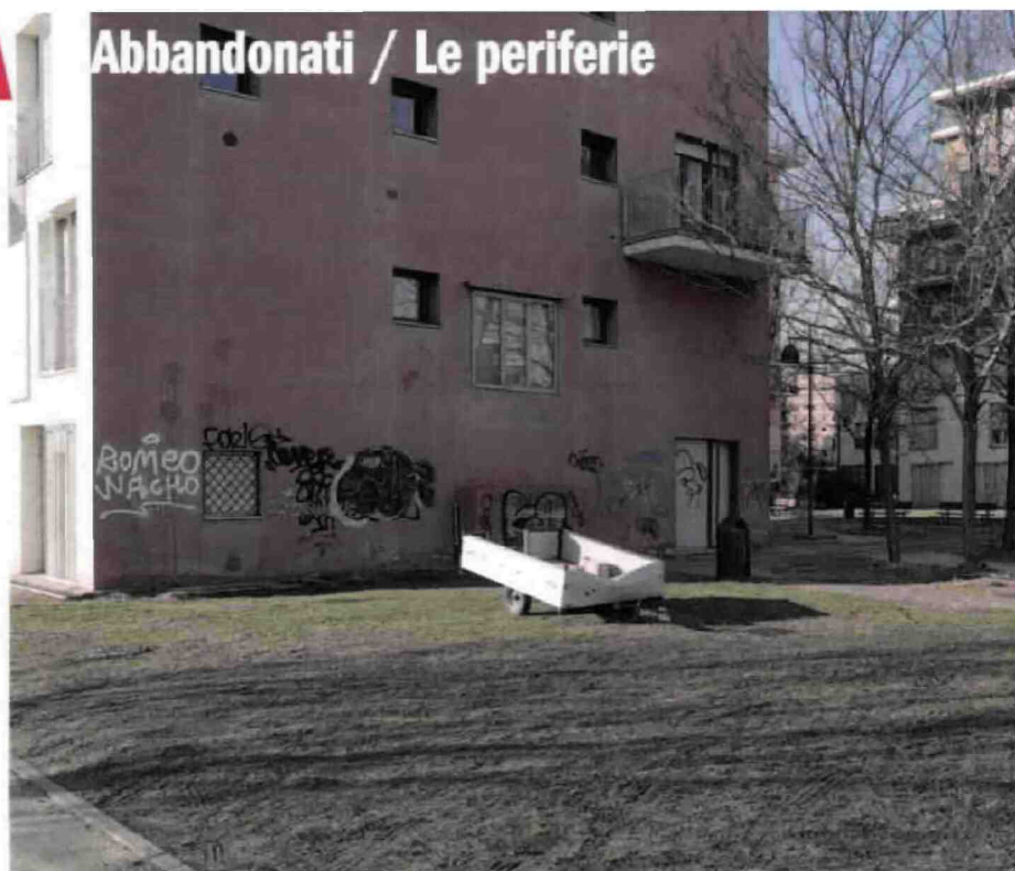
Sopra: stabili degradati nell'area del Lingotto, dove ci sono tensioni tra immigrati e italiani. Nell'altra pagina, in alto: un palazzo mal terminato tra gli sterrati di corso Grosseto, zona Borgo Vittoria; in basso: gli ex mercati generali in stato d'abbandono

Nell'antica fabbrica trasformata in sede della Circostrizione 5, in via Stradella 192, due stanze deserte e senza luce ospitano la mostra "Addio giovinezza! Gli effetti della Prima guerra mondiale sulla condizione dei giovani e delle donne nella periferia torinese". Il cartellone su "La moralità patriarcale del regime fascista" potrebbe descrivere l'Italia di oggi: «La politica dei bassi salari del regime, con ben due tagli nel